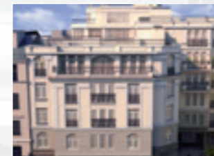
11 ЛИНИЯ В.О., 26

Жилой дом на Васильевском острове – образец современной архитектуры