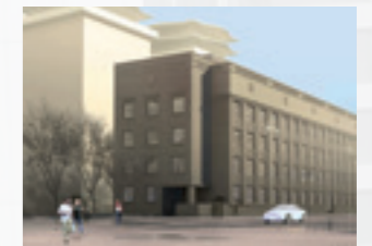
МОСКОВСКИЙ ПР., 94

Клубный дом, великолепно вписанный в окружающую среду