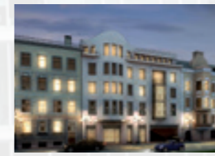
МАЛЫЙ ПР. В.О., 9

Лабораторный комплекс Института мозга человека РАН