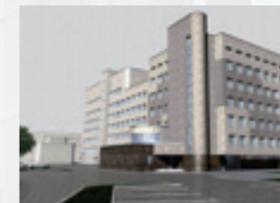
УЛ. АКАДЕМИКА ПАВЛОВА, 12

Жилой дом на Васильевском острове – образец современной архитектуры